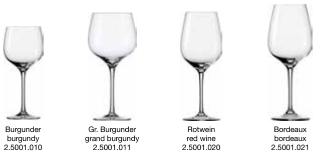
Burgunder burgundy 2.5001.010 Gr. Burgunder grand burgundy 2.5001.011 Rotwein red wine 2.5001.020 Bordeaux bordeaux 2.5001.021

SENSISPLUS FEATURE HIGH QUALITY LEAD-FREE CRYSTAL PULLED STEM TECHNOLOGY VERY DURABLE DISHWASHER PROOF