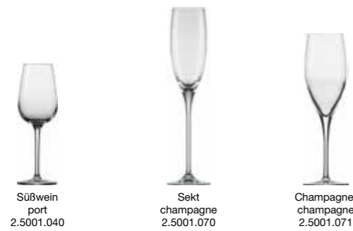
Süßwein port 2.5001.040 Sekt champagne 2.5001.070 Champagner champagne 2.5001.071