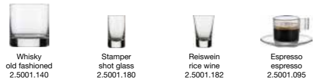
Whisky old fashioned 2.5001.140 Stamper shot glass 2.5001.180 Reiswein rice wine 2.5001.182 Espresso espresso 2.5001.095