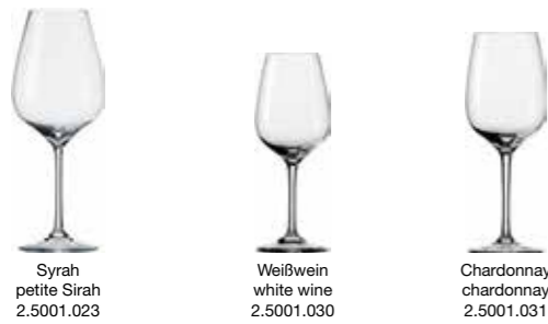
Syrah petite Sirah 2.5001.023 Weißwein white wine 2.5001.030 Chardonnay chardonnay 2.5001.031