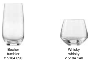
Becher tumbler 2.5184.090 Whisky whisky 2.5184.140