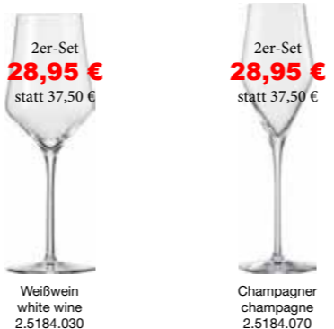
2er-Set 28,95 € statt 37,50 € 2er-Set 28,95 € statt 37,50 € Weißwein white wine 2.5184.030 Champagner champagne 2.5184.070