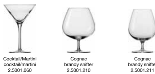
Cocktail/Martini cocktail/martini 2.5001.060 Cognac brandy snifter 2.5001.210 Cognac brandy snifter 2.5001.211