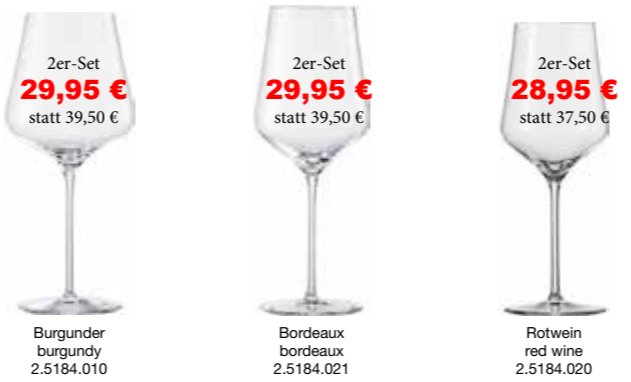
2er-Set 29,95 € statt 39,50 € 2er-Set 29,95 € statt 39,50 € 2er-Set 28,95 € statt 37,50 € Burgunder burgundy 2.5184.010 Bordeaux bordeaux 2.5184.021 Rotwein red wine 2.5184.020