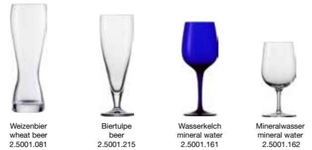
Weizenbier wheat beer 2.5001.081 Biertulpe beer 2.5001.215 Wasserkelch mineral water 2.5001.161 Mineralwasser mineral water 2.5001.162