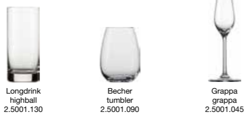
Longdrink highball 2.5001.130 Becher tumbler 2.5001.090 Grappa grappa 2.5001.045